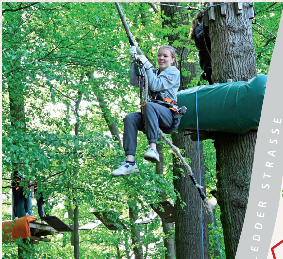
Das höchste der Gefühle: Den Tarzan-Sprung muss man einmal im Leben gemacht haben!

Auf einer Fläche von 30.000 Quadratmetern können Sie hier 15 Parcours in unterschiedlichen Schwierigkeitsstufen mit insgesamt 170 Kletterelementen wie Netzbrücken, Schaukeln, Baumhaus, Seilbahnen und Tarzan-Sprüngen in einer Höhe von einem bis 14 Metern erobern. Ob für einen Tagesausflug mit Familie und Freunden, Klassenfahrten oder Betriebsausflüge – der Kletterwald ruft – kommen Sie vorbei!