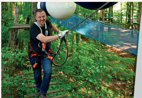
Der einzige Wald mit durchgehendem Sicherungssystem!